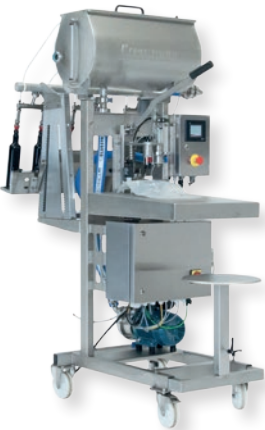
KOMBINIERT KBF 2000 & KRF 6

Die Kreuzmayr Reihenabfüller können Flaschen mit einer unterschiedlich einstellbaren Höhe befüllen. Diese erfolgt über Füllventile aus Edelstahl mit Gummiabdichtung. Die Leerflaschen werden unter die Einfüllstutzen gestellt. Dadurch öffnen sich die Füllventile in den Einfüllstutzen und die Flüssigkeit strömt aus dem Puffertank durch Falldruck in die Flaschen.