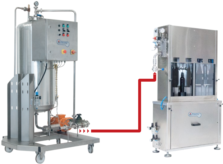
Bildlegende: 1) Karbonisatorpumpe, 2) Pneumatisch betätigte Füllinheit, 3) Trockenlaufschutz, 4) Druckregleinheit für CO 2 & Anschluss für karbonisierte Flüssigkeiten, 5) Kronenkorkverschleißer

Die Flaschen werden in die Maschine hineingestellt und nach Betätigen des Luftventils automatisch auf das Füllventil angepresst, wobei sich gleichzeitig das Sicherheitsfenster schließt. Nach Beendigung des Befüllens werden die Flaschen entnommen und auf einer Verschleißmaschine verschlossen.