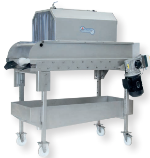
KFB 10 / 20

Das Obst oder Gemüse zu Beginn auf den Bandsortierer legen, der diese dann anschließend zum Rollesortierer weiterbefördert. Nach Beendigung der Reinigung rollen die entstieltten und gewaschenen Früchte sicher zum Maschinenauslauf. Die gesamte Anlage wird voll automatisch mit einer Start- und Stoptaste gesteuert.